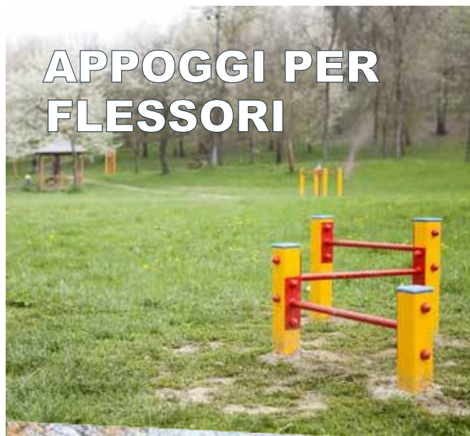
APPOGGI PER FLESSORI