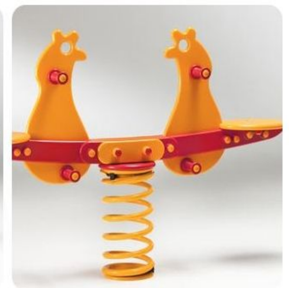
Bilico galline a molla