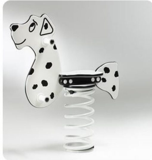
Dalmata a molla