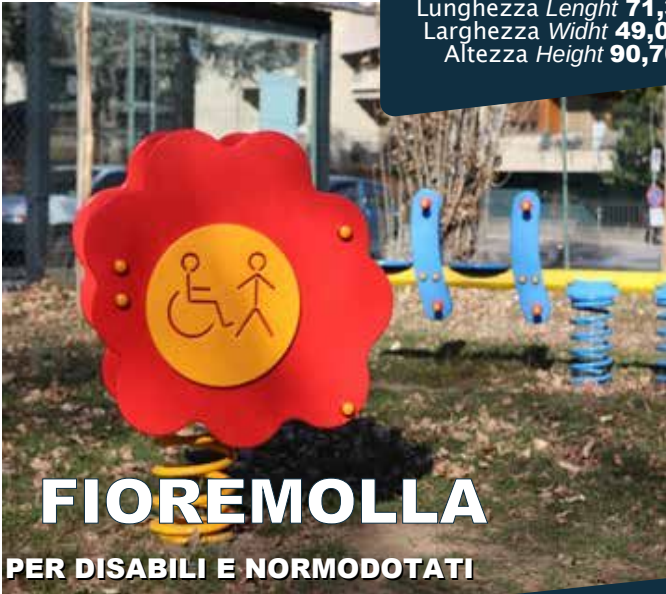
FIOREMOLLA PER DISABILI E NORMODOTATI

Età d'uso Age 0-12 anni Lunghezza Length 71,30 cm Larghezza Width 49,00 cm Altezza Height 90,70 cm