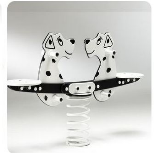
Bilico dalmata a molla