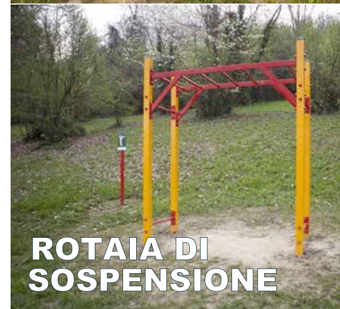
ROTAIA DI SOSPENSIONE