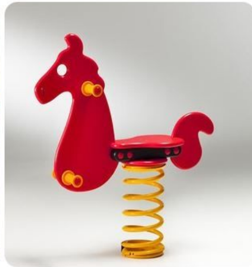
Cavallo a molla