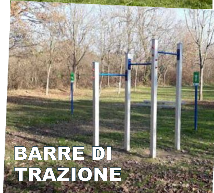
BARRE DI TRAZIONE