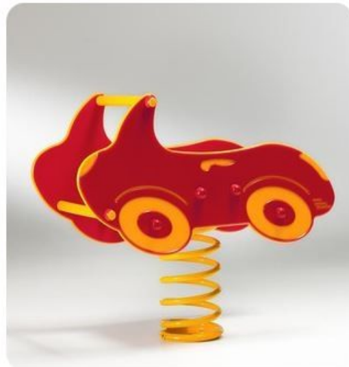
Auto a molla