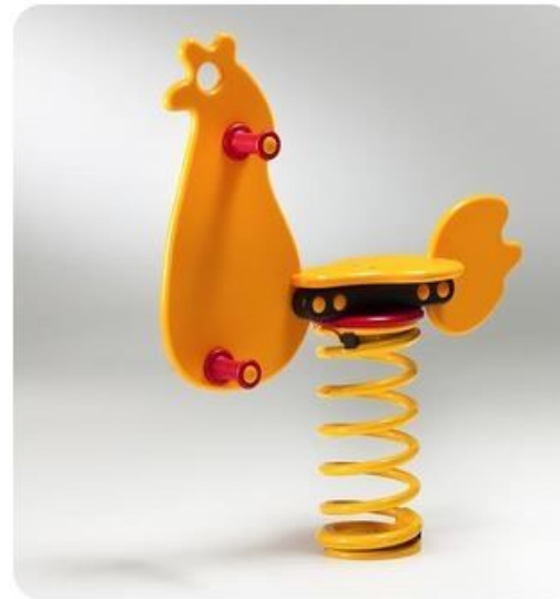
Gallina a molla