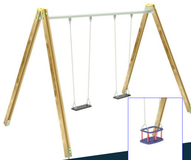
ALTALENA LEGNO e ACCIAIO

337 x 208 x h240 cm Area di sicurezza Space required: 760 x 631 cm HIC: 125 cm Pavimentazione Flooring: 21 mq