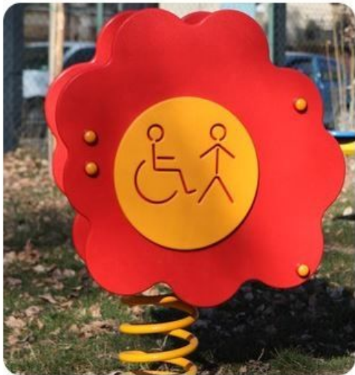
Fiore a molla disabili e normodotati

Sono realizzati in polietilene PE-HD colorato in massa, ad alta densità completamente riciclabile