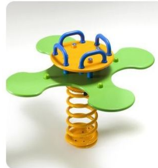
Quadrifoglio a molla