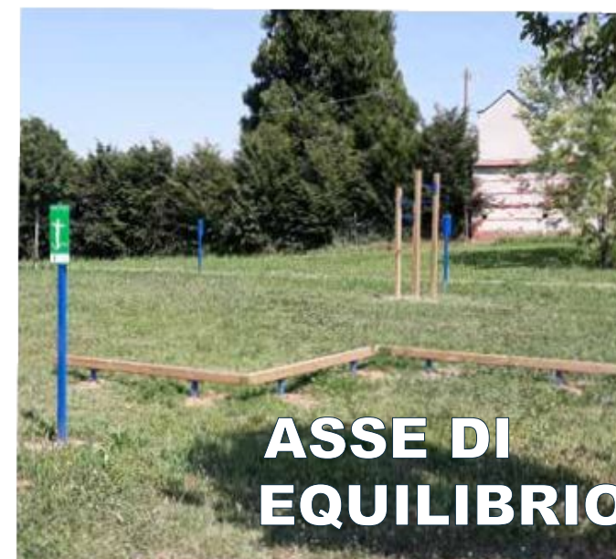
ASSE DI EQUILIBRIO