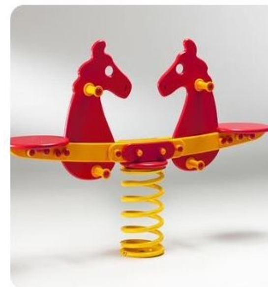
Bilico cavalli a molla