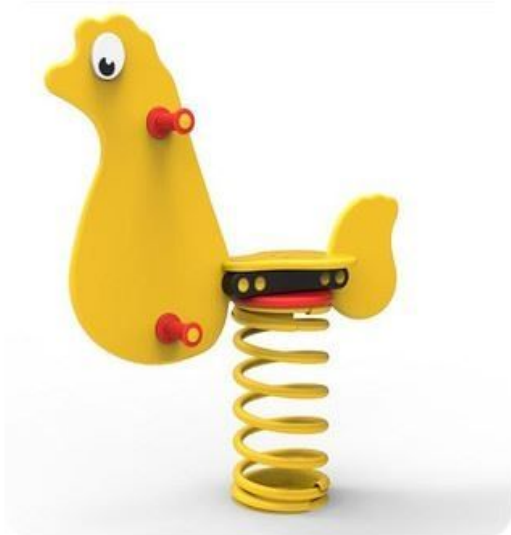
Pulcino a molla