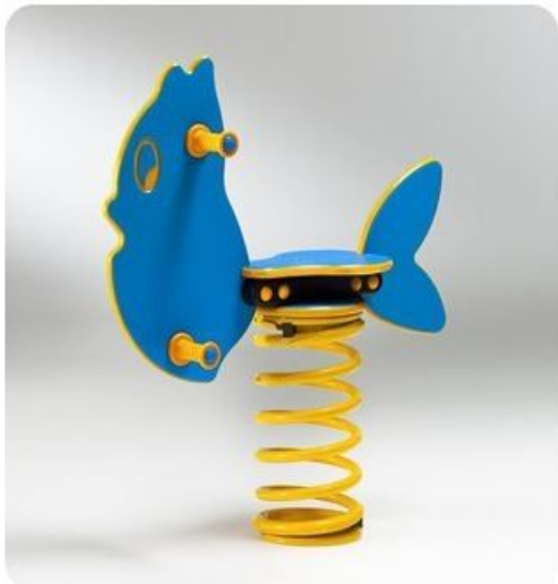
Pesce a molla