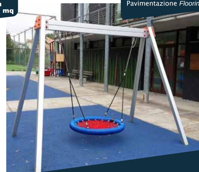
ALTALENA A CESTO

Dimensioni Dimensions: 337 x 208 x h240 cm Area di sicurezza Space required: 760 x 631 cm HIC: 125 cm Pavimentazione Flooring: 21 mq