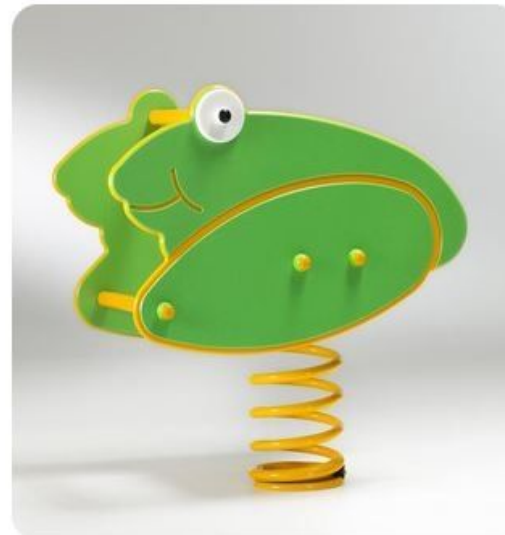
Rana a molla