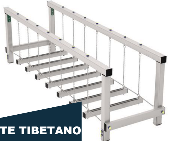
PONTE TIBETANO ALLUMINIO

TUTTI GLI ELEMENTI DI FISSAGGIO, VITI, DADI, RONDELLE ECC. SONO IN ACCIAIO INOSSIDABILE E PROTETTI DA GHIERE E TAPPI IN POLIETILENE