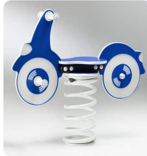
Moto a molla